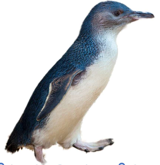
லிட்டில் பென்குயின் (little)