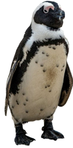
ஆப்ரிக்கன் பென்குயின் (African penguin)