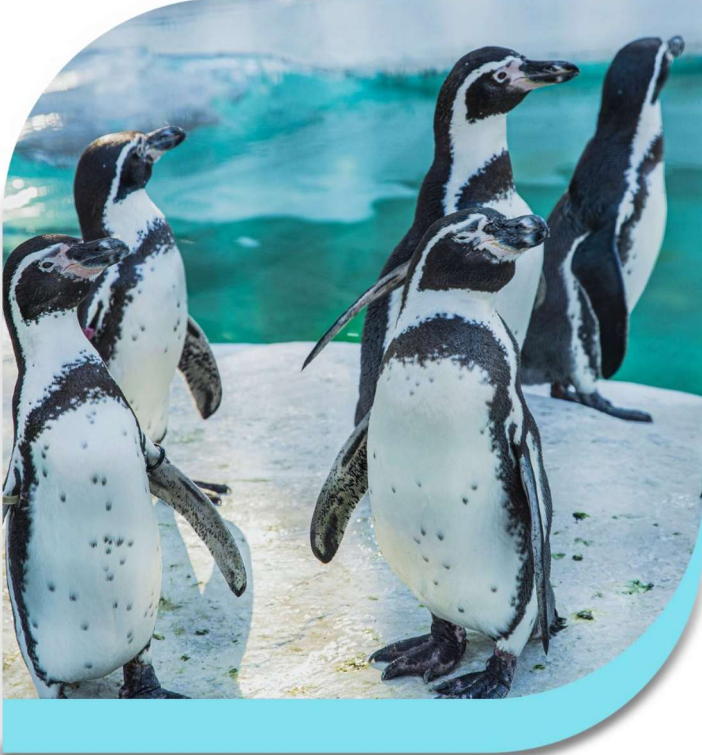
கலாபகோஸ் பென்குயின் (Galapagos penguin)

தீவுகளில் ஒன்றான கலாபகோஸ் தீவிலும் (Galapagos) வாழ்கின்றன. இங்கு வாழும் பென்குயின் கலாபகோஸ் பென்குயின் (Galapagos penguin) என்றும், ஈக்வடார் பென்குயின் (Ecuador penguin) என்றும் அழைக்கப்படுகின்றன.